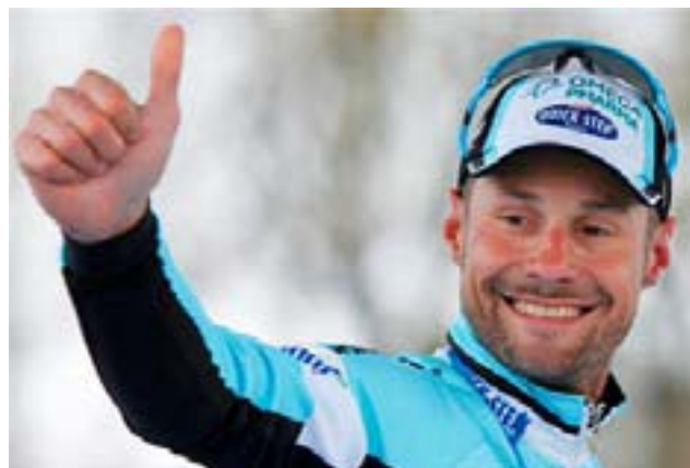
De heer TOM BOONEN & Mevrouw MARIEKE VERVOORT, wel door alle sportliefhebbers gekend, hebben het peter- & meterschap van de 4-Daagse ter harte genomen en gaan deze organisatie volkomen steunen.